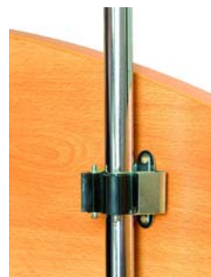
Držák hole kovový

Při montáži plastového držáku nejprve vychyľte pryžovou část mimo plastové pouzdro a následně postupujte obdobným způsobem jako u držáku zinkovaného. Po řádném dotažení držáku vraťte pryžovou část zpět do vnitřního prostoru plastového pouzdra. Tím je držák hole připraven k používání.