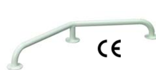
Madlo 135° 3 příruby